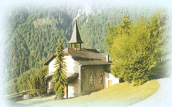
Chapelle de Miex

De ce balcon ensoleillé, vous découvrirez un panorama inattendu sur le Chablais et les Alpes vaudoises. Ce hameau situé à 7 km en amont de Vouvry est accessible toute l'année par une route carrossable ou par un bucolique chemin pédestre. Miex est également desservi par un service postal régulier (Dpt Villeneuve ou Vouvry).