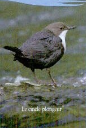
Le cincle plongeur

Pleasantly situated in a large valley, amid the very first bends of the River Doubs, Mouthe invites you to go for a walk and discover local history and natural curiosities. If you follow the circuit from the town hall (and the parking lot at the source) you will come to the two highlights of this area, the source of the Doubs and the Moutat peat bog, while slowly going past some old buildings, the origins of this village.