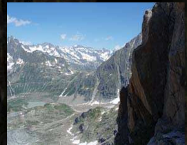
Blick zurück zum Steingletscher