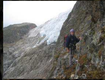
Inmitten der Gletscher